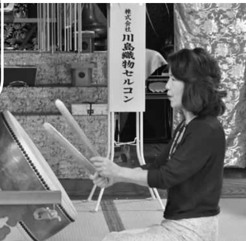
山内に太鼓が響いた