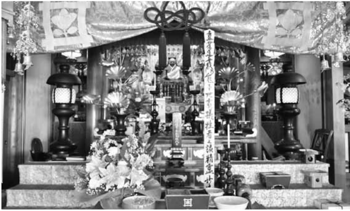
犠牲者追善供養会