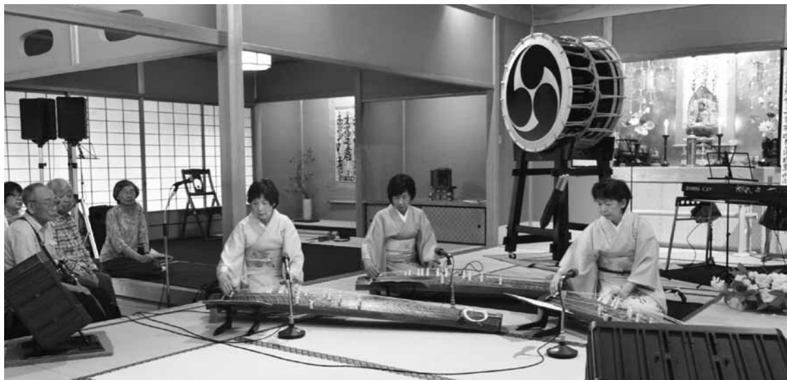
生田流宮城社の琴