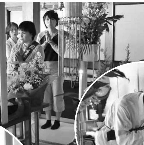
卒塔婆に瀧水供養する