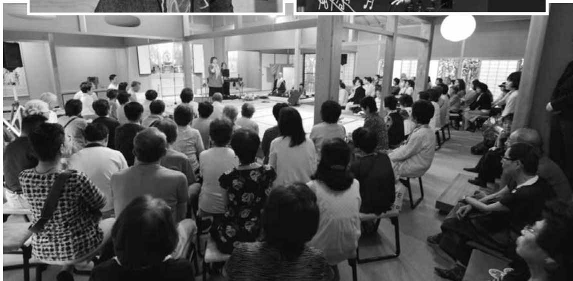
熱気溢れるコンサート会場