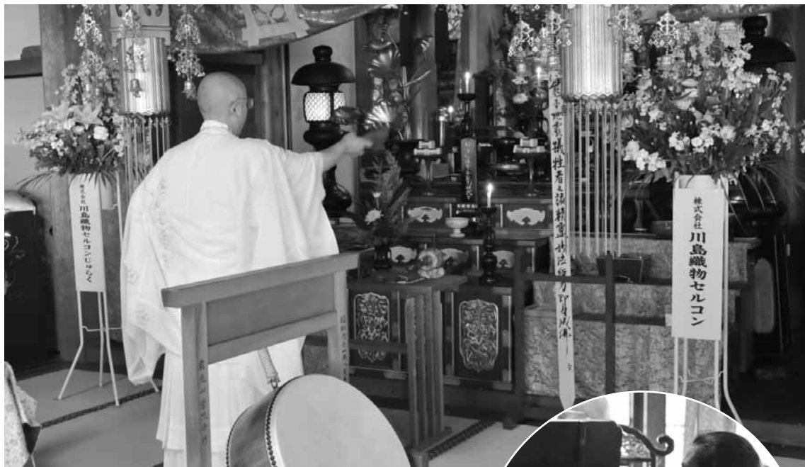
秘妙五段修鍊加持