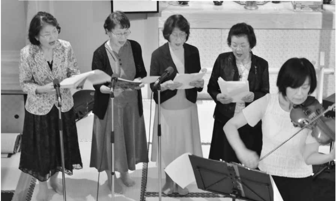
常照寺コーラス部による合唱