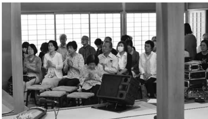
参加者全員が合掌して祈った!