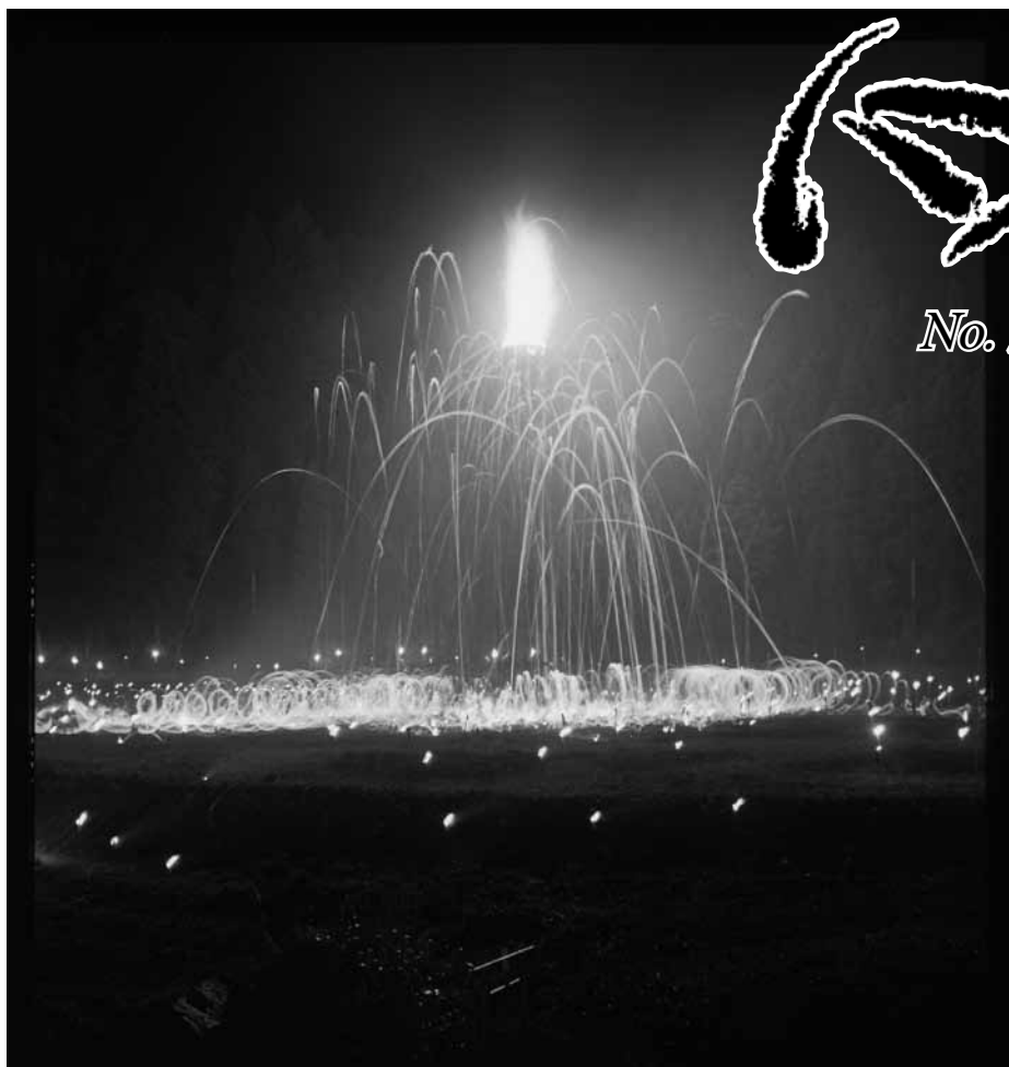
— 花背松上げ —